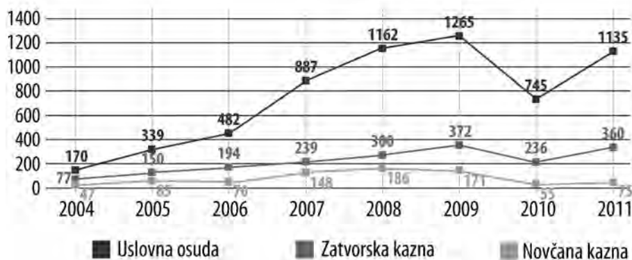
Grafikon 4: Broj osuda i vrsta krivične sankcije protiv punoletnih počinitelja krivičnog dela nasilja u porodici: uslovne, zatvorske i novčane kazne u periodu 2004–2011.

Na osnovu analize može se zaključiti da postoji trend porasta broja krivičnih prijava 16 za krivično delo nasilja u porodici u periodu 2004–2011 (mada postoji pad u 2010; Grafikon 3). Taj broj se povećao 3,5 puta: sa 1.009 u 2004. na 3.550 u 2011. godini, što se može tumačiti, najverovatnije, porastom poverenja žrtava u pravosudni sistem i policiju, razvijanjem svesti o kažnjivosti ovog krivičnog dela (usled medijskih akcija ženskih NVO), sa jedne, kao i većim senzibilitetom policije (koja pokazuje veću spremnost da pokrene krivične prijave), sa druge strane.